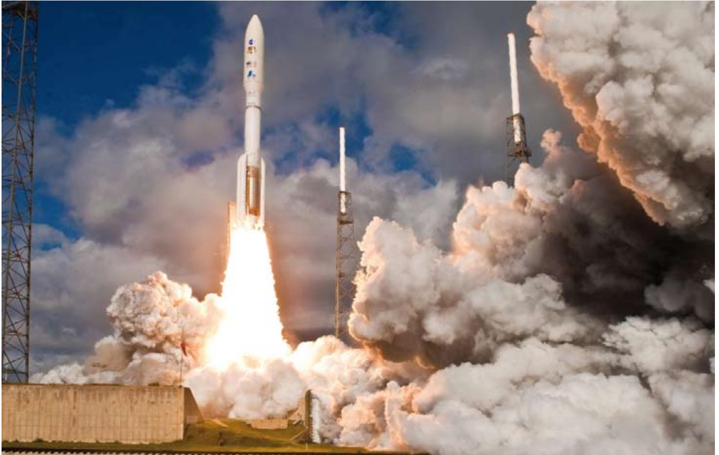
Momento del despegue del cohete que puso en marcha la misión Mars Science Laboratory.

Además, el vehículo transporta un instrumento que se utiliza para monitorizar la radiación natural de Marte, que proporcionará una información vital para el diseño de sistemas de seguridad que prevengan a los futuros astronautas que realicen las primeras misiones de exploración humana en el planeta rojo.