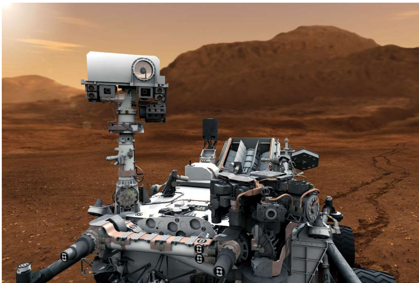
Recreación del nuevo "rover" en la superficie marciana.

El "Curiosity" (la misión se denomina Mars Science Laboratory) es el cuarto vehículo todoterreno capaz de desplazarse por la superficie del planeta vecino enviado por la NASA desde el pionero "Sojourner", de la misión "Mars Pathfinder", que, en 1997, supuso un enorme éxito para la agencia espacial estadouni-